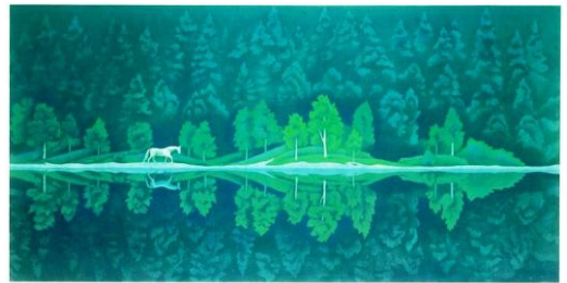
▲ 東山魁夷 「緑の詩」